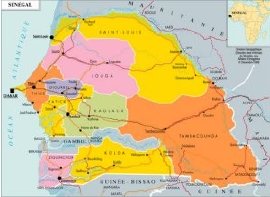
Fig. 1 : Carte géographique du Sénégal